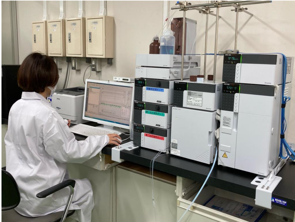
水質検査実施風景